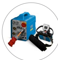
Kompakt och lätt styrning, smidig fjärrstyrning med bildskärm

Väggsågen WSE1621*** har utvecklats för universell användning varje dag på bygget. Det nyutvecklade systemet sätter nya standarder för väggsågar tack vare de digitala utrustningsdelarna samt de kompakta och lätta komponenterna. Superlätt bladskydd och drivmotor med verktygsfritt snabbfäste gör monteringen och